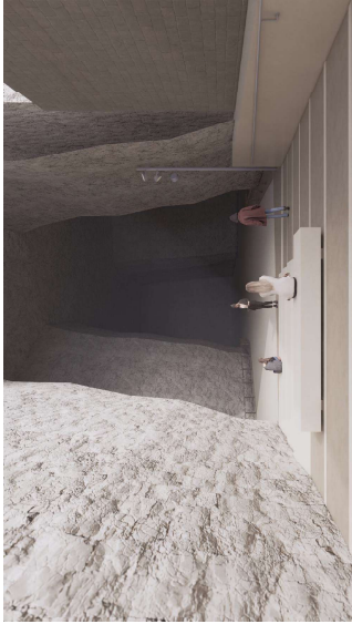
Vista di progetto